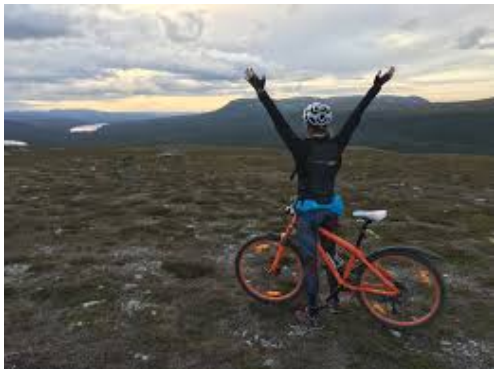
En cykeltur i terrängen