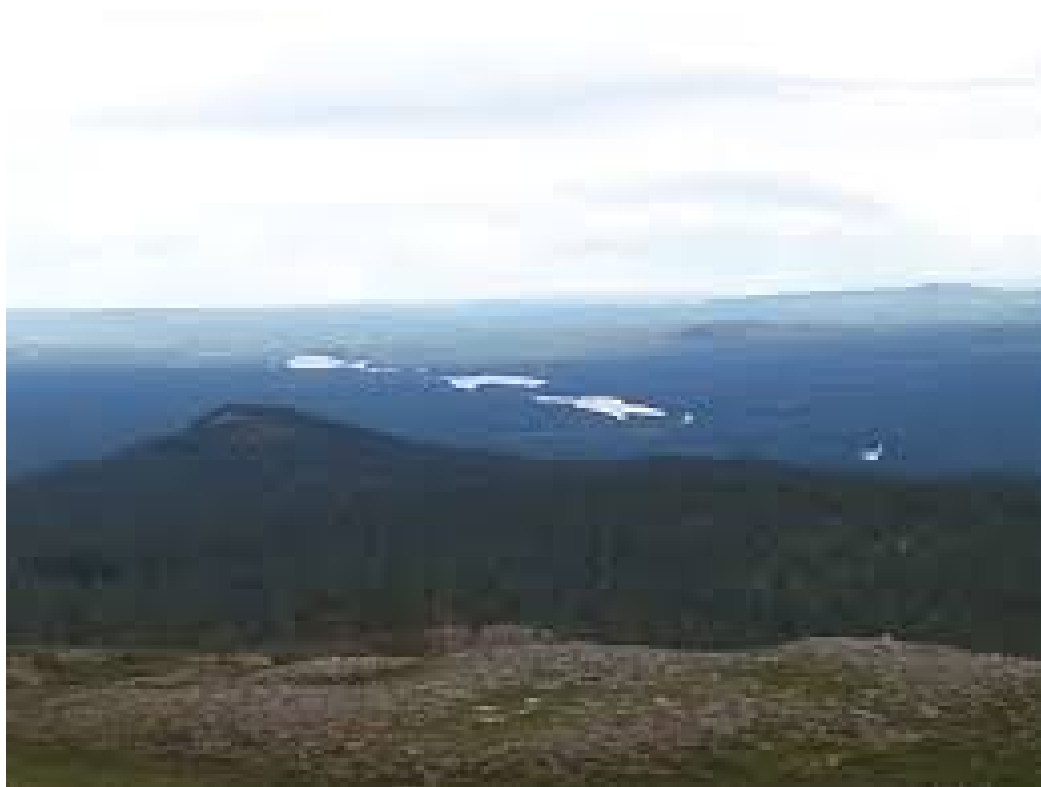
Vilka vyer om man har vingar.....