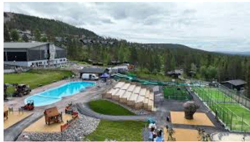
....och sen ett dopp i utepoolen