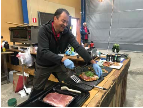
Hangarpizzan blir till