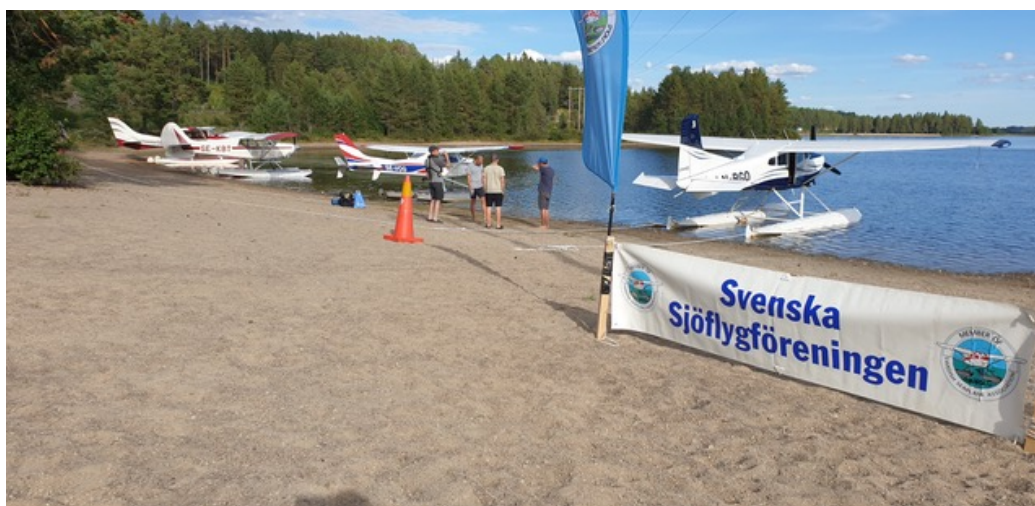
Strålande väder i Idre 2022. Finns plats för många fler maskiner!!

2023 års Fly-In kommer att gå av stapeln 2:a helgen i augusti om ni medlemmar tycker så. Svara på enkäten så vi vet! Fantastiska möjligheter att ta sig dit, sjöflyg, landflyg (1600 m nyasfalterad bana) och naturligtvis även bil. Som frestelse lite bilder från årets Fly-In.