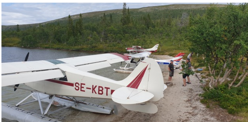
Utflykt till närbelägen fjällsjö, Idre 2022